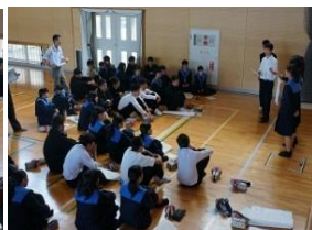
クラスでプレゼン