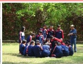
TAP(徳地アドベンチャープログラム)