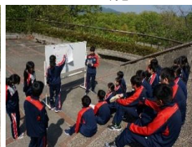
「ブラックボックスの中身を探ろう」「紙飛行機よ、どこまでも！」