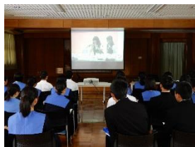
全国発表会を視聴

昨年度実施された、SSH、SGHの全国発表会を視聴しました。また、図書室に置かれている全国の高校で実施されている研究を調べました。また、理数科3年生のポスター発表を聞いて、研究とはどのようなものか触れました。