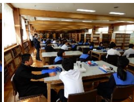
図書室で、全国の研究を調査