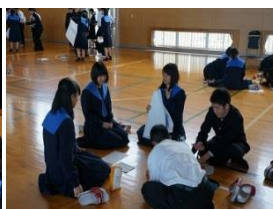
グループで資料作成