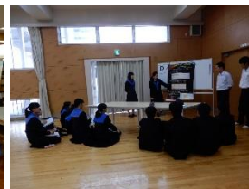
理数科3年生によるポスター発表