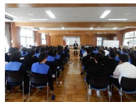
活動の流れを説明

探究科で「基礎探究」の授業が始まりました。オリエンテーションでは、3年間の活動の流れ、1年次の活動についてなど担当者からの説明、その後、指導担当教員とグループメンバーの顔合わせが行われました。