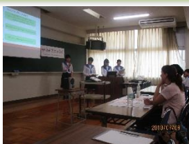
発表会の様子(最優秀チーム)