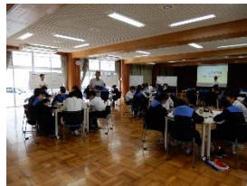
学術分野紹介の様子