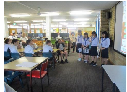
コタラ高校でプレゼン