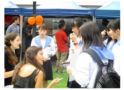
大学でインタビュー調査