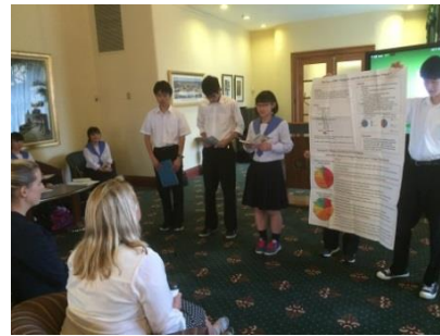
市長さんを前にプレゼン