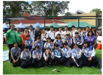
ニューカッスル大学で記念撮影

3月17日～25日の9日間、オーストラリアのニューカッスルにて海外アウトリーチを行いました。今年度参加したのは、1年SGコース14名、2年SGコース3名、かたばみ会（同窓会）派遣の3名の計20名。姉妹校のコタラ高校の生徒宅でホームステイしながら、高校の授業に参加するとともに、大学や企業、市庁舎などを訪問しました。市庁舎では市長さんの前で課題研究に関するプレゼンテーションを行い、コメントをいただきました。また、ニューカッスル大学では、「ハーモニーデイ」と呼ばれる留学生が主催の文化交流行事が行われており、多くの留学生にインタビューを行い、研究について必要な情報を入手することができました。これらの活動を通して、生徒たちは日本では経験できないことを多く経験し、広い視野を身に付けて帰国しました。これからきっと、この体験を活かして2、3年次の探究活動を充実させてくれることでしょう。