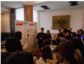
ポスターセッション（2年）