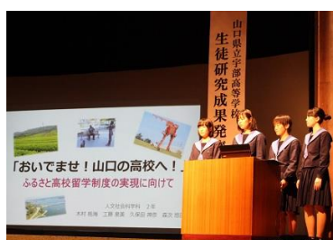
口頭発表（人文社会科学分野2）