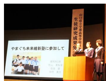
1年有志による報告