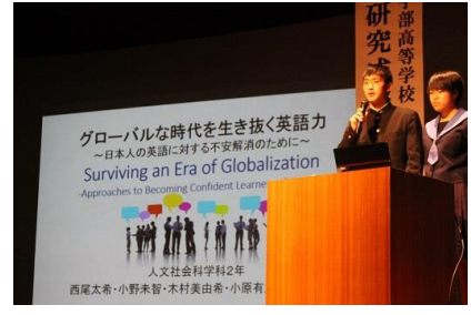
口頭発表（人文社会科学分野1）