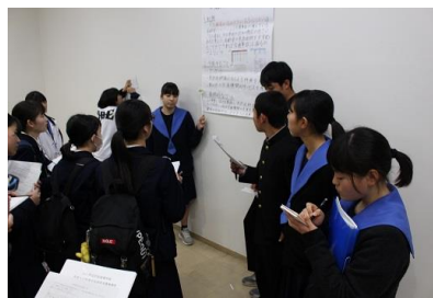
ポスターセッション（1年）