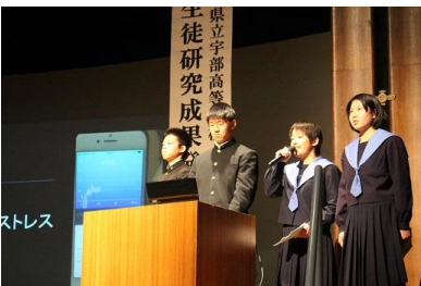
口頭発表（自然科学分野1）