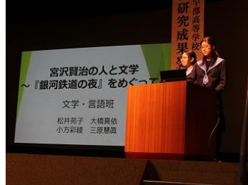
フラッシュトーク