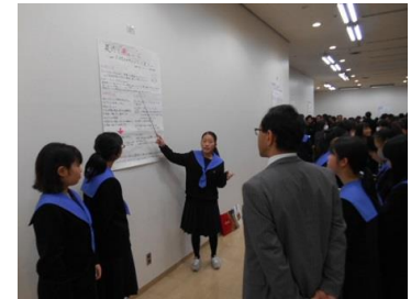
ポスターセッション（1年）